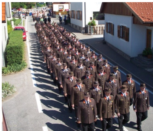
Mit einem imposanten Einzug begann der Festakt