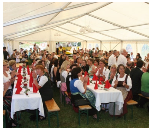
Ein volles Festzelt