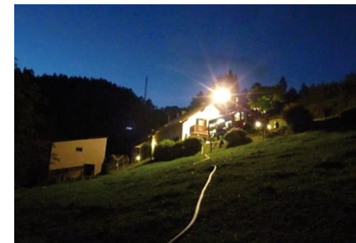
Ausleuchtung des gesamten Übungsgeländes

Neben den großen Monatsübungen sind vor allem Übungen in der Gruppe – wie hier die Einschulung auf die neue Tragkraftspritze – notwendig.