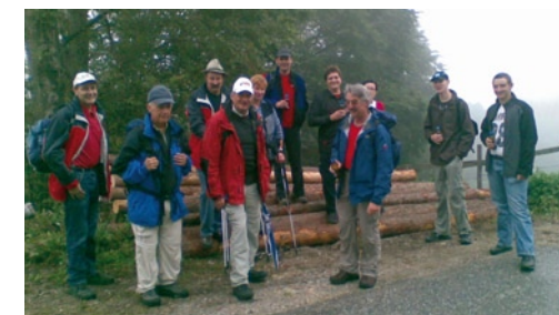
Schöckl-Wanderung im Herbst