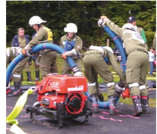
Nassleistungsbewerb in Plenzengreith