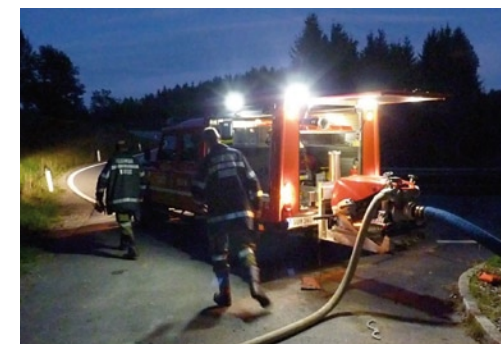
Wasserversorgung vom Reitbach mittels neuer Tragkraftspritze

Übungsannahme: Traktorunfall mit Menschen in Zwangslage. Beübt wurde dabei die schonende Bergung des Verunglückten mit Hebekissen im unwegsamen Gelände.