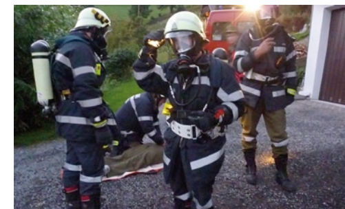
Bergung der vermissten Personen durch einen Atemschutztrupp

Bei der September-Übung beim Anwesen Reiter in der Hohenbergstraße wurde folgendes beübt: